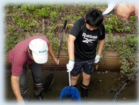
アドベンチャークラブ