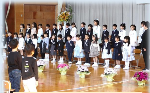
36名の新1年生が入学式していきま した。元気な返事もできました！

保護者の皆様、地域の皆様からも「自律・貢献・志」を意識していただきながら、平田地区の皆様と学校が同じ目標に向かって様々な活動に取り組んでまいりたいと思います。令和8年度も、ご理解とご協力をどうぞよろしくお願いいたします。