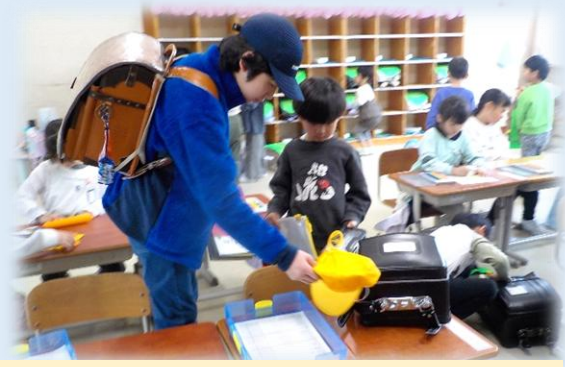
朝は6年生がお手伝いをしてくれています。 とてもうれしいです。ありがとう！