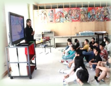
SOSの出し方教室の様子

南平田学校では、子どもたちの成長を支えるとともに安心して相談でき、気持ちがほっとする環境づくりに努めていきます。お困りのことがありましたら、ぜひご相談ください。